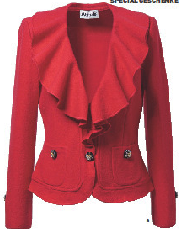
DIE WAFREN EINER FRAU 1 Knallroter Lippenstift „Rouge Volupté“ von YSL, um 28 Euro 2 Schwirfelnirgend: Pumps mit Wildleder- und Pythonplateau, von Versace, um 680 Euro 3 Dekorativ und praktisch: CD-Regal „Cléo“ (gibt's auch in Schwarz) von Habitat, um 160 Euro 4 Feminine Jacke aus Merinowolle, von Attitude, um 340 Euro