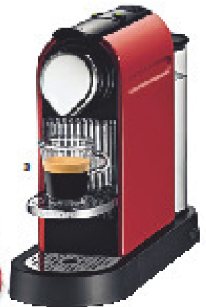
RED LIGHT 1 Dessous-Duo von Moschino, um 163 und 48 Euro 2 Kaninchendecke, von Katrin Leuze Collection, um 1475 Euro 3 „Nespresso Cube Gl&Z Krups“, in Fire Engine Red, um 195 Euro, www.amazon.de