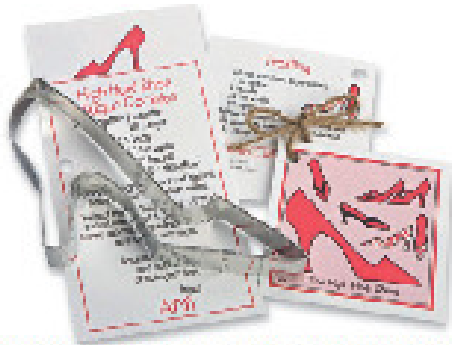
SO SWEET! Plätzchenausstecher „High Heel Shoe“ mit Rezept, circa 10 Euro, www.american-heritage.de