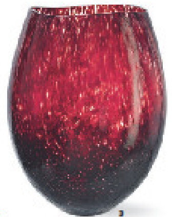
STARKES STATEMENT 1 Stuhl „Trinidad“ mit filigraner Lehne, von Frederica (gibt's auch in anderen Farben), um 513 Euro, www.markantade.de 2 Kamera mit IQ: „Flexline 200“ verfügt über Gesichts- und Lächelerkennung, von Rollei, um 170 Euro 3 Mundgeblasenes Prachtstück: Vase „Dino“ von Kosta Boda, um 480 Euro, www.daedala.de